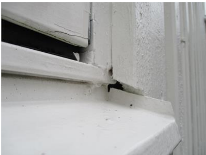
Otättheter vid infästning av fönsterbleck